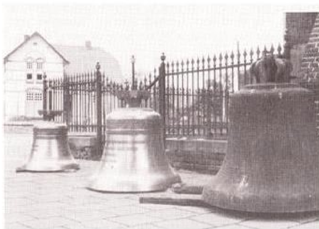
1966: de drie Groessense klokken afgeleverd bij de kerk.