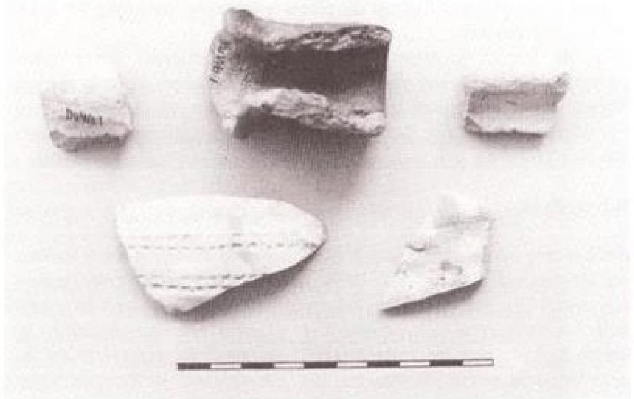
Afb.1. Enkele scherven uit de 10e-12e eeuw, afkomstig van de Woerd