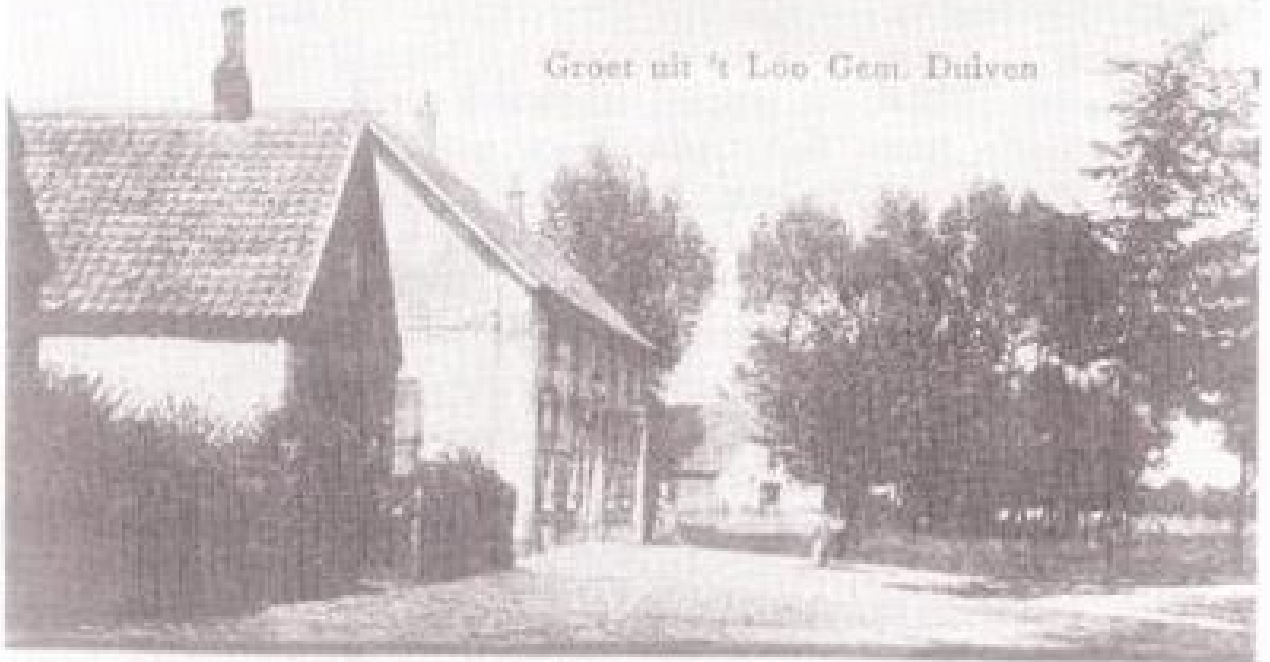
Groet uit 't Loo Gem. Duiven