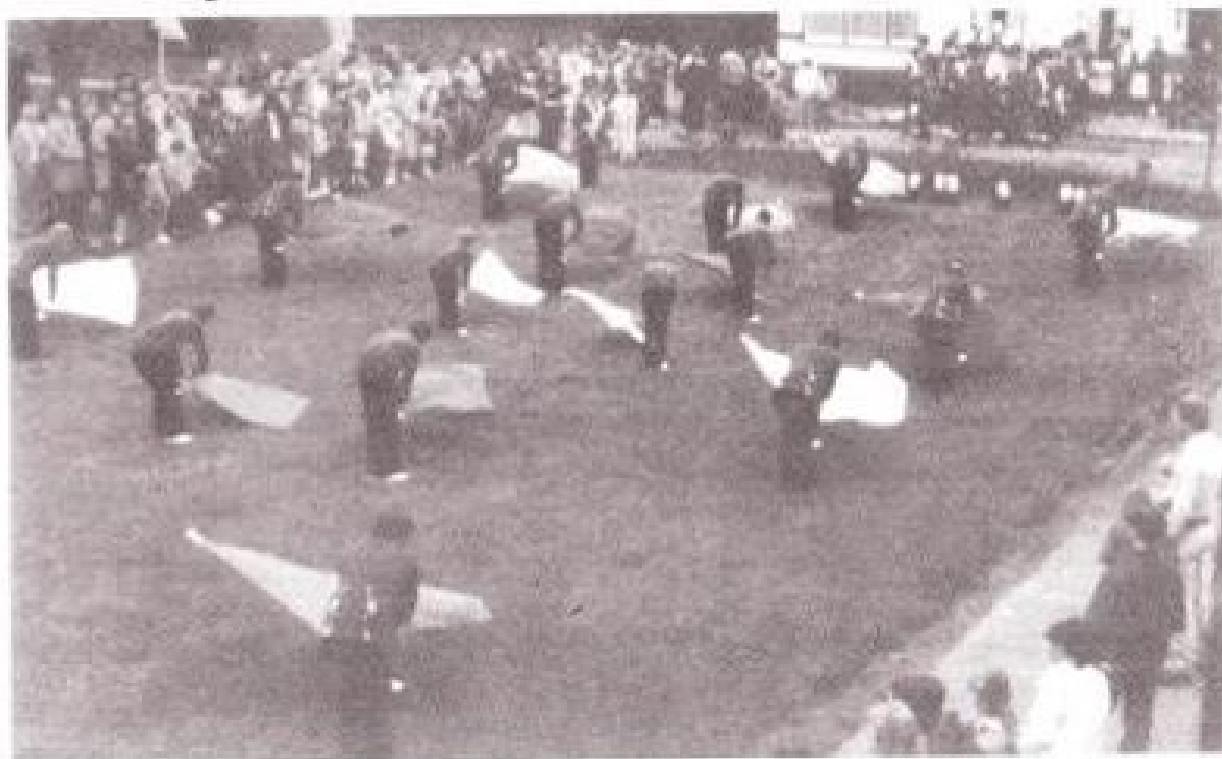
De vendelhulde op het grasveld voor de pastorie na de processie 1981